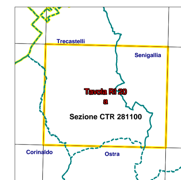
CONFINI AMMINISTRATIVI -- INQUADRAMENTO CTR 1:10.000